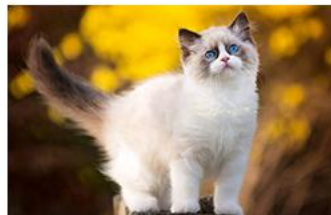
▶ 大肠杆菌禽流感病毒