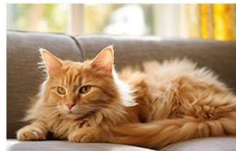
▶ 传染性法氏囊病病毒